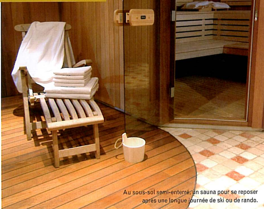
Au sous-sol semi-enterré, un sauna pour se reposer après une longue journée de ski ou de rando.