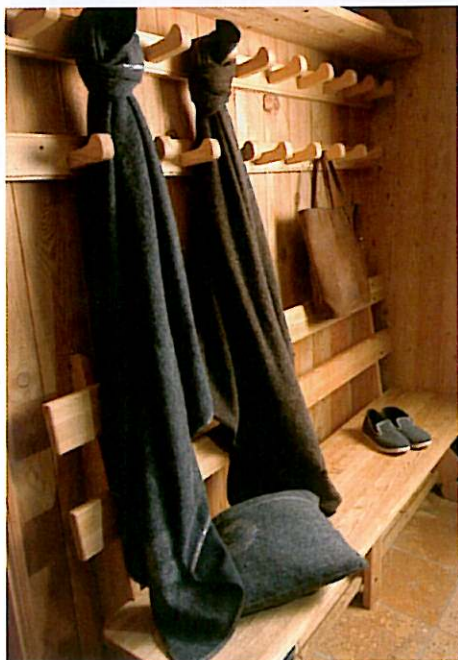
À l'entrée, un local vestiaire pour déposer bottes et manteaux de randonnée.

Plus d'informations sur : www.chalet-prestige.com