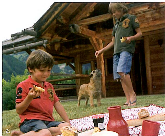
1. Parfaitement intégré dans son environnement, ce grand chalet tout en mélèze semble être là depuis toujours. 2. Le mélèze a une teinte dorée et chaude. Laissé brut et ne nécessitant aucun entretien, il se patine naturellement avec le temps. À droite. Les cantonnières, destinées à cacher les tringles des rideaux, ont été fabriquées par les Chalets Bayrou, en mélèze bien sûr.

S ituée à La Salle, dans la vallée de Serre-Chevalier (Hautes-Alpes), La Grande Ourse a marqué un tournant majeur dans l'histoire des Chalets Bayrou. Véritable défi technique, elle a été à l'origine d'une toute nouvelle gamme de chalets tout en mélèze (menuiseries, charpente, bardages), et Bayrou continue aujourd'hui d'essaimer les petits frères de l'Ourse dans tout le Briançonnais.